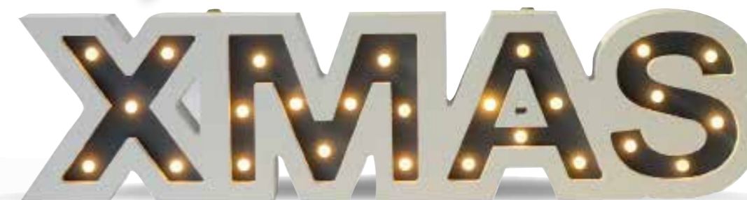
Para fans de la Navidad, este cartel reproduce la abreviatura de la palabra Christmas. En blanco y dorado, es perfecto para estas fiestas. Mide 60 x 15,5 cm y funciona con pilas (39 €); en Kenay Home.