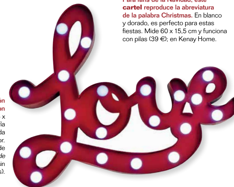
Esta declaración de amor brilla con luz propia. En 45 x 34,5 cm, su caligrafía manuscrita le da un aire encantador. Palabra de metal, de www.car-moebel.de (95,80 € sin bombillas ni pilas).