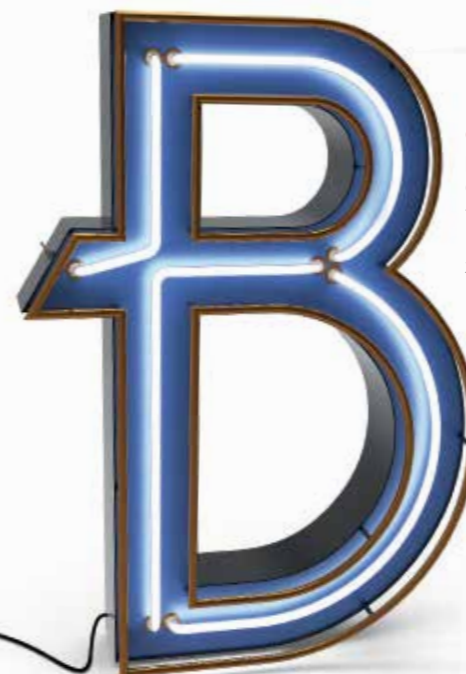
El neón destaca sobre el aluminio azul y los perfiles de latón. ¿El efecto? La letra B parece tener sombra. De la firma Delightfull, mide 71 x 100 x 20 cm (2.710 €); es de www.portobellostreet.es