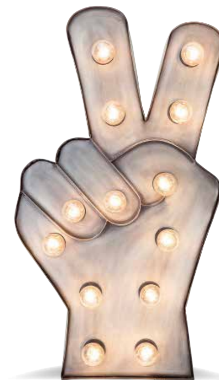
El símbolo de la victoria adquiere proporciones king size. Se llama Peace, es de hierro y mide 71 x 39,5 cm. Lámpara, de La Oca (139 €).

Guimaldas y estrellas son un clásico a la hora de iluminar la casa. Hoy, las posibilidades se amplían con carteles, palabras, letras y señales que funcionan con pilas o enchufados a la red eléctrica. Aquí tienes algunos ejemplos.